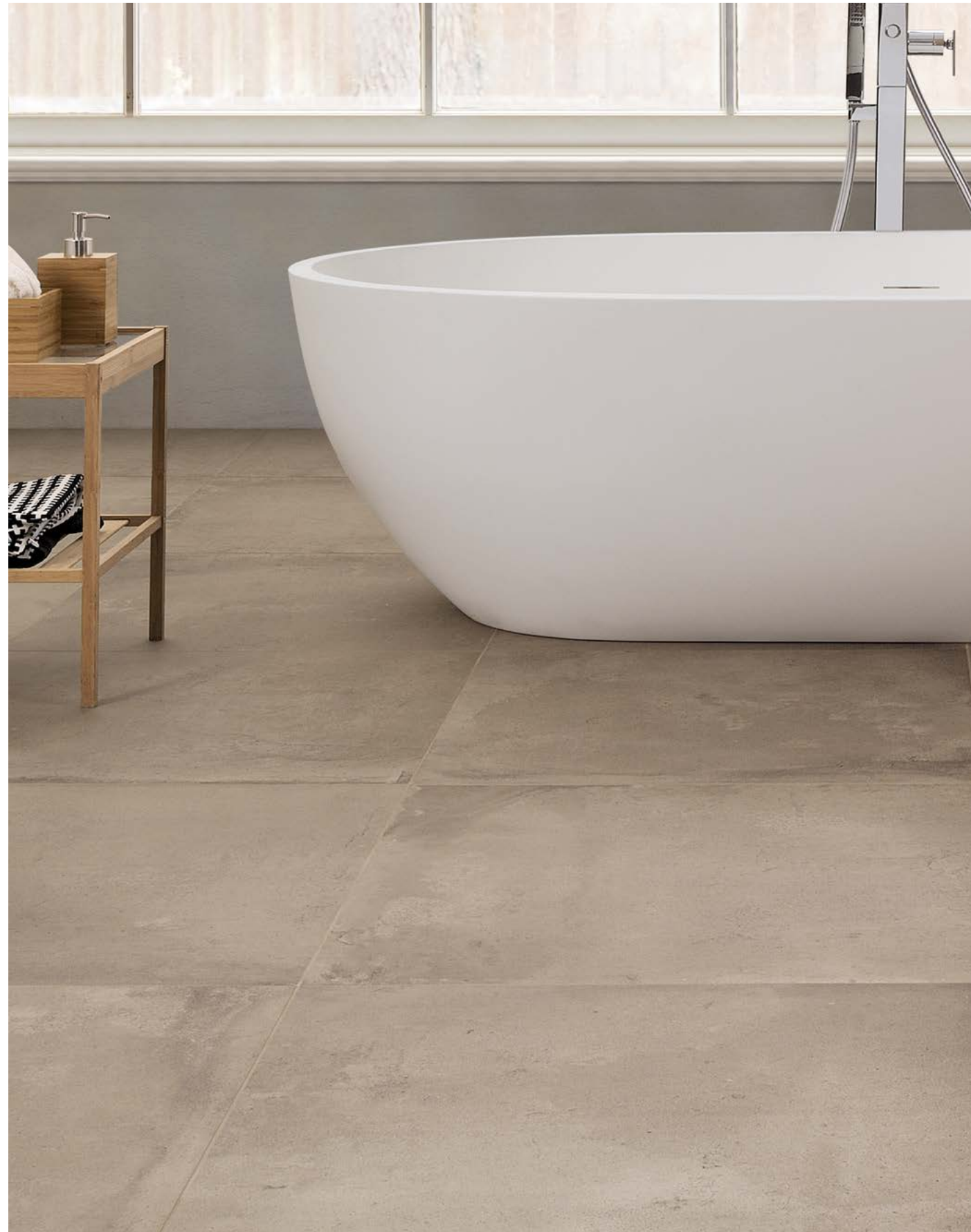
Brown 60,4x60,4 - 24"x24" Naturale Rettificato