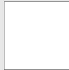
INDOOR | OUTDOOR 60,4x60,4 - 24"x24" ≠ 9 mm