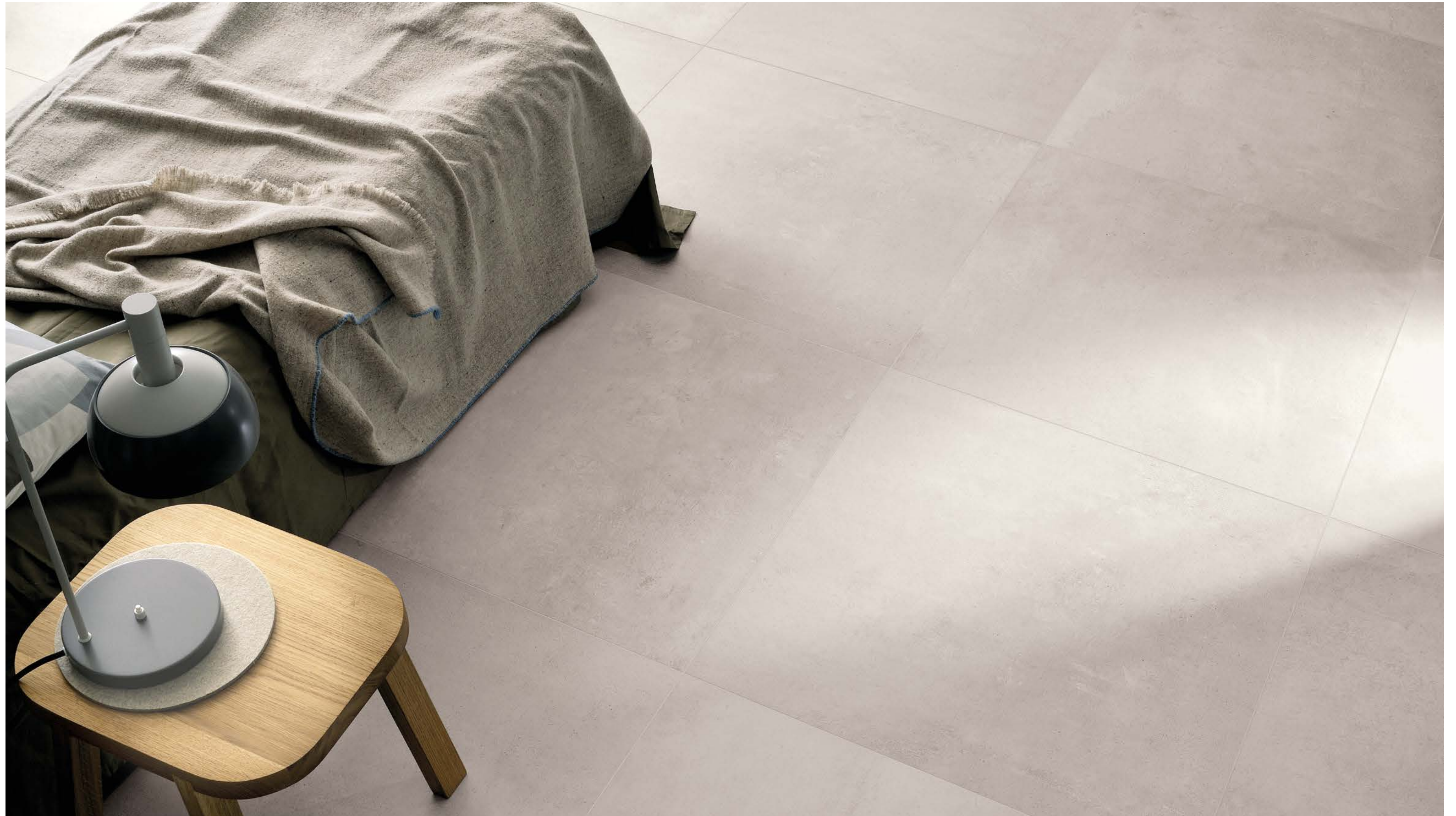
Light Grey 75,5x75,5 - 30"x30" Naturale Rettificato