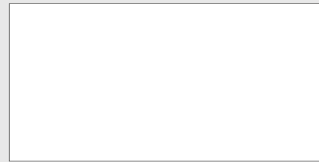
INDOOR 60,4x120,8 - 24"x48" ≠ 9 mm

1 formato - 1 size - 1 Format - 1 format