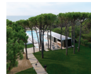
Parisotto + Formenton Architetti with the cooperation of Studio Progest