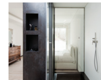
Studio Stimamiglio & Architects